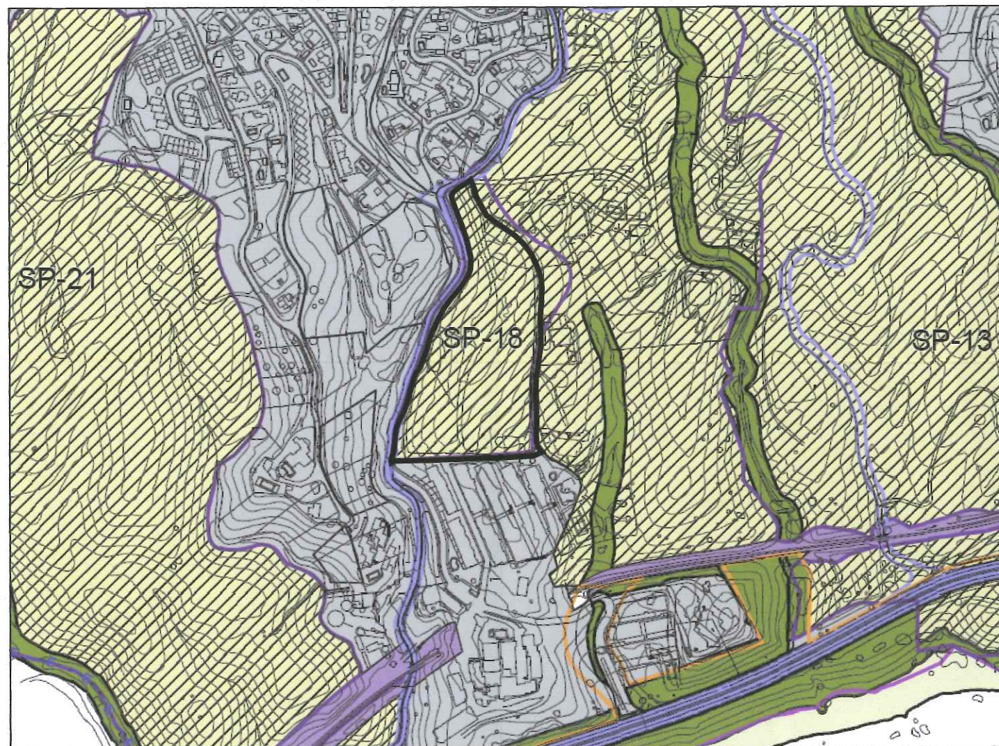
CLASIFICACION DEL SUELO ESTRUCTURA GENERAL Y ORGANICA DEL SUELO ESTADO RESULTANTE E=1/5000