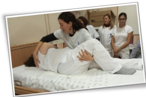
Alumnos/as del Itinerario: Atención sociosanitaria a personas dependientes en instituciones sociales