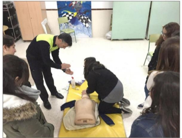
En la formación obligatoria está el conocimiento amplio de los primeros auxilios.

BENALMÁDENA SÁBADO, 3 DE FEBRERO DE 2024 5