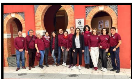
Alumnos/as del Itinerario “DOCENCIA DE LA FORMACIÓN PROFESIONAL PARA EL EMPLEO”

SUBVENCIÓN EFECTIVAMENTE EJECUTADA: 68.594,04€