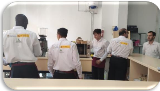
Alumnos/as del Itinerario: Operaciones básicas de restaurante y bar