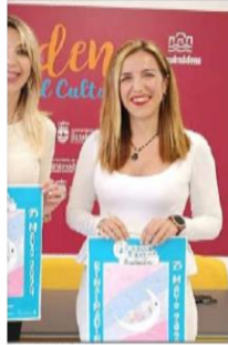
avanzaron los detalles del evento.

hasta la Luna para tomar conciencia de la inmensa belleza de este satélite y de la diversidad e inmensidad del Universo. Se han escrito millones de páginas sobre la Luna, desde la perspectiva científica, astrológica, literaria, mitológica y artística. Por eso, este maratón persigue acercar a los benalmadenses a la Luna y sus encantos, a través de los Cuentos Contados.