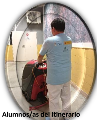
Alumnos/as del Itinerario Limpieza de superficies y mobiliario en edificios y locales