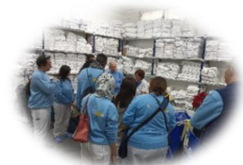
Alumnos/as del Itinerario: Operaciones básicas de pisos en alojamientos