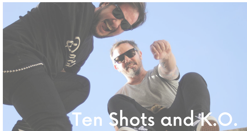
Ten Shots and K.O.