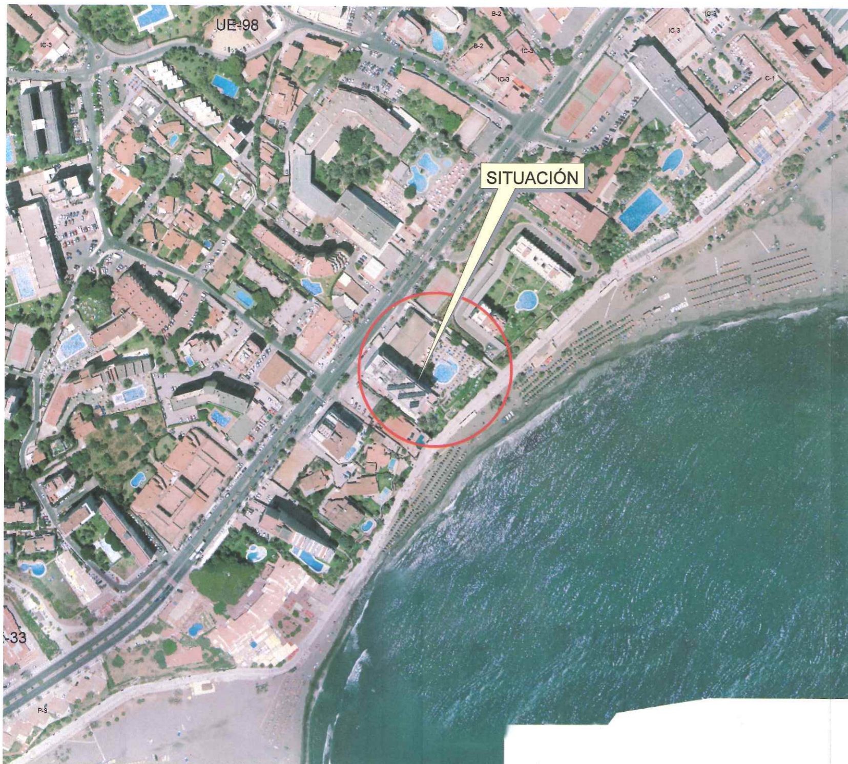
ORTOFOTO BENALMÁDENA COSTA