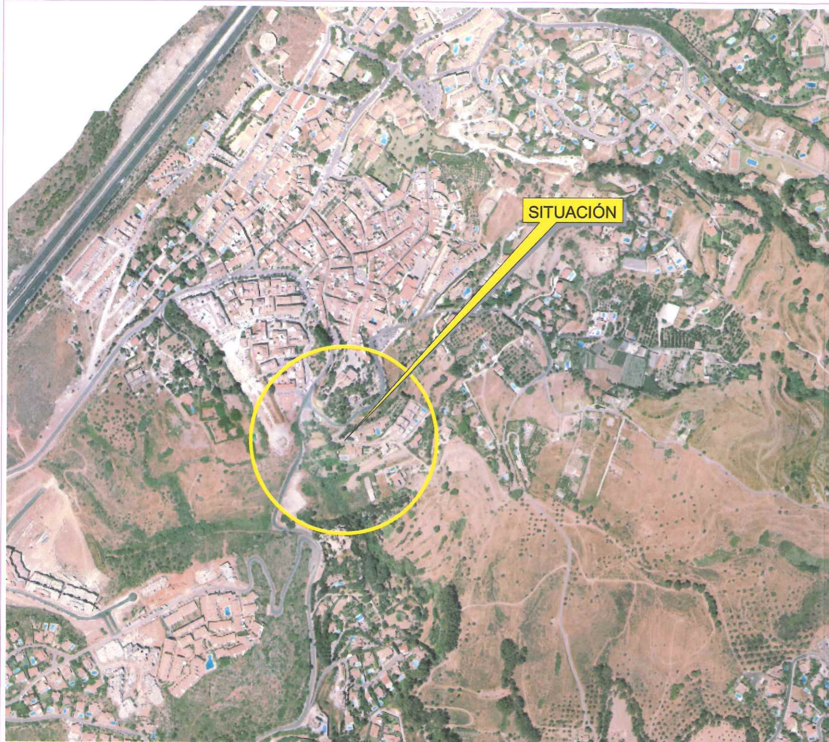
ORTOFOTO BENALMÁDENA PUEBLO