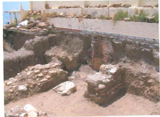
Medianera este del local.