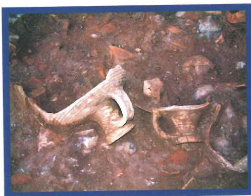
Depósito de ánforas Beltrán 68 y Keay XXIII halladas en el horno