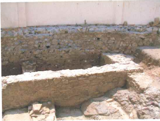
Medianera norte del local.

Los tramos de muro de gran consistencia se introducen en el local por su zona norte y este: