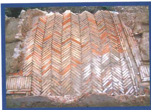
Ara "quadrata" de spicatum