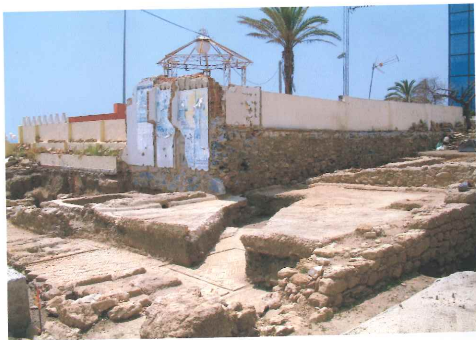
El torcularium y las piletas de signinum se introducen en el local.