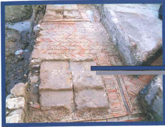
Pileta de signinum amortizando el torcularium.