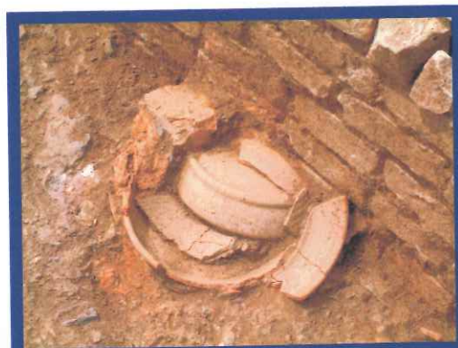
Imitación de cerámica de cocina africana: cazuelas Lamboglia 10 A