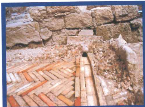
Detalle de canalis por donde discurría el aceite prensado.