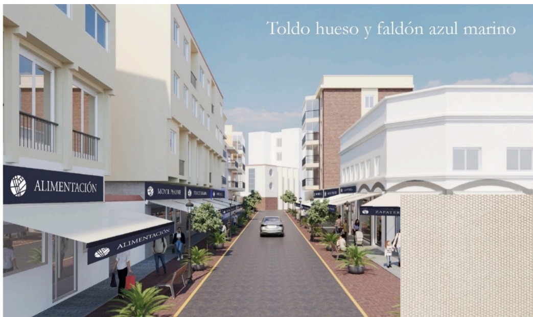
Toldo hueso y faldón azul marino

El resultado debe ser similar al fotomontaje adjunto.