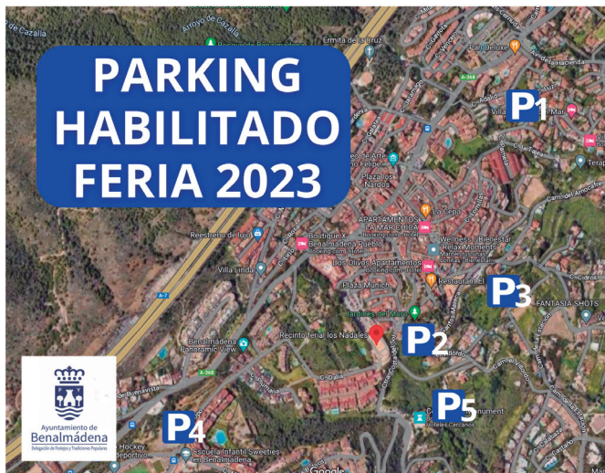
P1: Aparcamientos "Las Moriscas" P2: Parking "Los Nadales" P3: C/ Santos Mareca P4: Retamar (Estupa Budista) P5: Castillo de Colomares